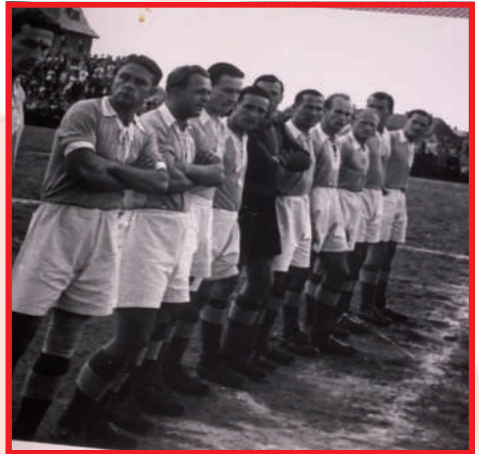
Fritz Meusel als Spieler Ende der 1940 Jahre beim 1. FC Schweinfurt 05