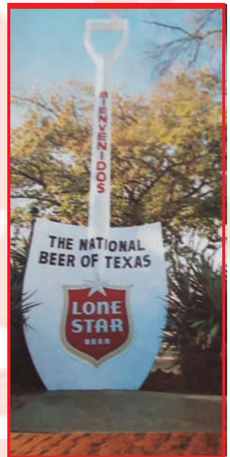
Der Sponsor der Unterkünfte. Die Lone Star Brauerei

folgenden 2 Tage fuhren wir mit den Autos nach Laredo in Mexico und an den Golf von Mexico. Danach war Ruhe für 2 Tage angesagt, in der Stadt und an unserem Pool. Jetzt gab es nur noch Fußball, sonntags gegen die Pearl Brauerei, Dienstag gegen die Trinity Universität und am Donnerstag noch mal gegen Lone-Star Team. Bei allen 4 Spielen gingen wir als Sieger vom Platz. Zum Abschied gab es von Lone-Star noch mal jede Menge Bier und gegenseitige Einladungen, die von San Antonio im Sommer 1976 und von uns im April 1976 eingelöst wurden. Die letzte Station war dann 2 Tage in New Orleans. Hier wurden eine Stadtrundfahrt und eine Schifffahrt auf dem Mississippi unternommen. Abends war