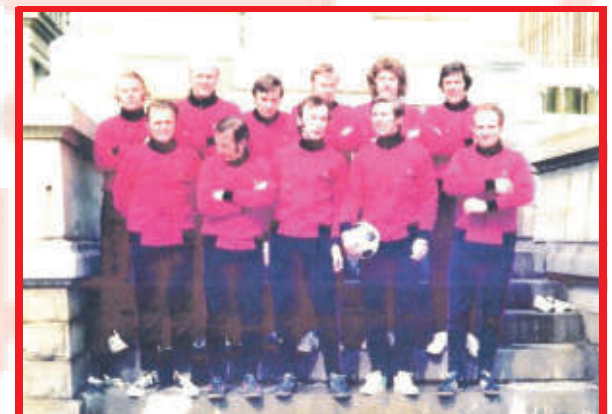
Spiel gegen Buffalo