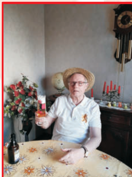
In der Corona Zeit macht man es sich zu Hause schön