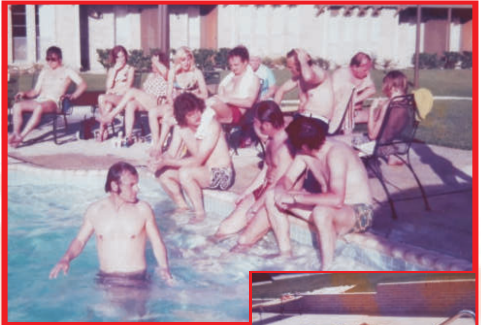
Eine neue Appartementanlage mit eigenem Pool. Das war Genuss pur. Da war die Welt in Ordnung.

Der Empfang in San Antonio war überwältigend, vom Flughafen fuhren wir in ein Partyhaus. Hier gab es Essen und sehr viel Lone Star Bier. Danach ging es zu unserer Unterkunft die uns sprachlos machte. Jedes Ehepaar bekam ein 2 Zimmer-Apartment kostenlos bis zu unserer Abreise am 19. April. Meine Schwester hatte diesen Sponsor gefunden, der gerade diese Apartmentanlage mit riesiger Pool Anlage gebaut hatte. Da noch nicht alle Zimmer vermietet waren hat er uns diese 12 Apartments zur Verfügung gestellt. Die benötigte Bettwäsche hat meine Schwester bei ihren Bekannten eingesammelt und mit ihrer Freundin Helen, alle Betten bezogen. Die Kühlschränke in den Küchen waren mit Lone-Star Bier ausreichend bestückt. Am 7. April fand dann schon das 1. Spiel gegen das Lone-Star Team statt, am nächsten Tag morgens kam ein Journalist der Zeitung und ein Vertreter von VW und übergaben uns einen VW-Bus für unsere Zeit in San Antonio. Da das Fernsehen und die Tageszeitung von unserer Anwesenheit berichtet haben wurden wir in Geschäften und Restaurants oft auf Deutsch angesprochen. Der 8. Tag war dann City Tag und ab 17 Uhr Party mit German Bratwurst bei meiner Schwester im Garten. Es waren viele Freunde meiner Schwester und meinem Schwager, sowie der Bürgermeister von San Antonio anwesend. Die