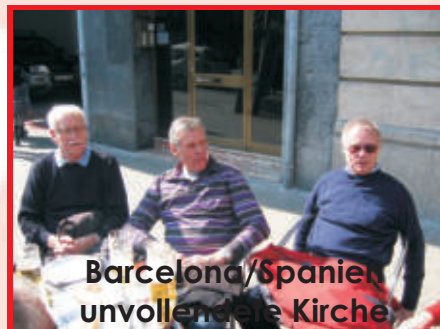
Barcelona/Spanien unvollendete Kirche