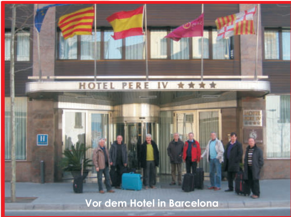
Vor dem Hotel in Barcelona