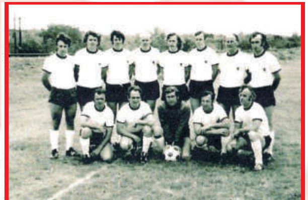
Spiel gegen San Antonio