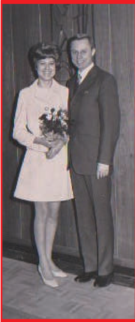
Hochzeitsfoto am 02.05.1969