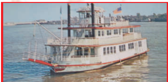
Der Typische Mississippi Dampfer

das French Quarter mit der Bourbon Street unser zu Hause, hier gab es sehr viele Jazz Lokale. Am 21. April flogen wir von New Orleans über New York nach Frankfurt zurück.