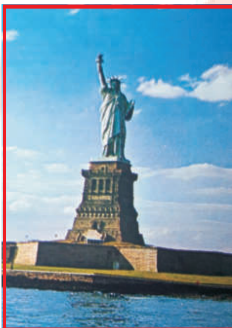
Die Freiheitsstatue, der Inbegriff von Amerika