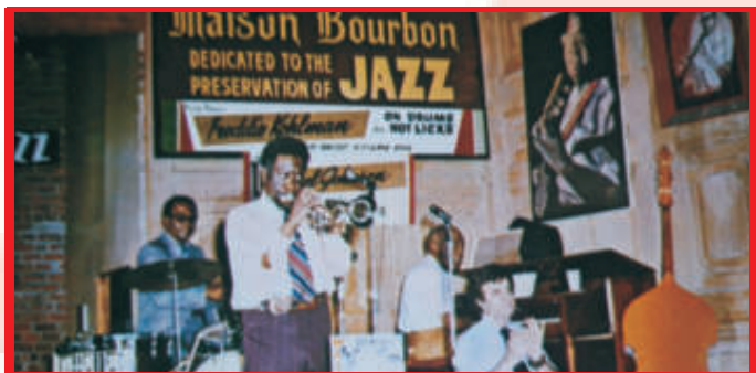
Ein typisches Jazzlokal in New Orleans