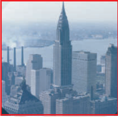
New-York, einfach nur beeindruckend Bild Links: Empire State Building, Bild rechts: Manhattan