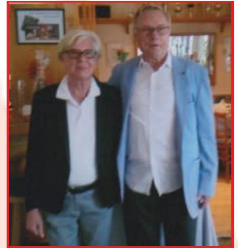
Goldene Hochzeit am 02.05.2019