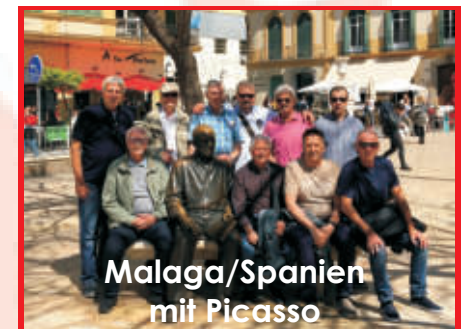
Malaga/Spanien mit Picasso