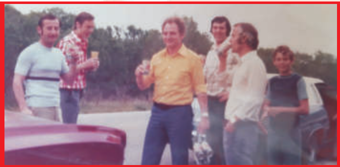
Verschlaufpause während der Fahrt