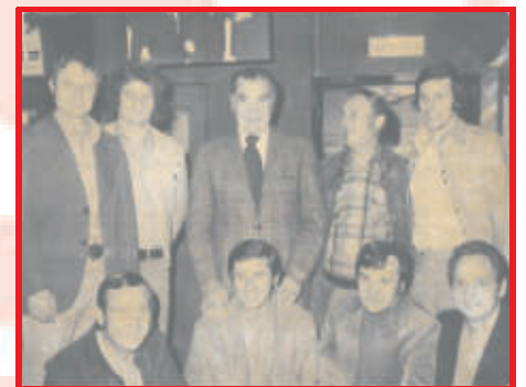
Im Lokal von Jack Dempsey, Ex Boxweltmeister von 1922-1926.