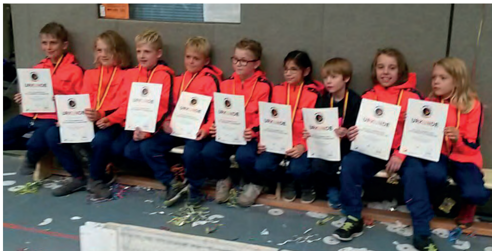
Freude über den 4. Platz bei den Deutschen Meisterschaften