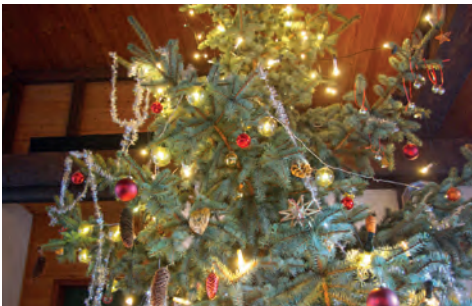
Unser festlich geschmückter Christbaum