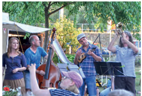
Gute Stimmung mit der Band