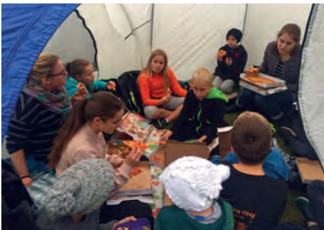
Zeltlager im Griesheimer Freibad