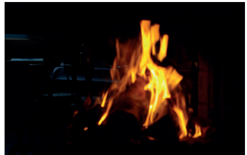
Gemütlichkeit am offenen Kamin