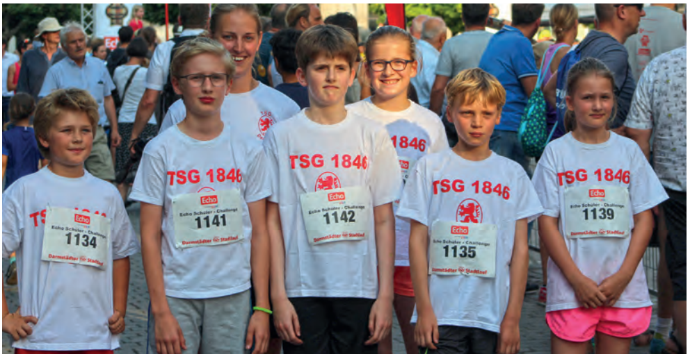
Echo Schüler-Challenge