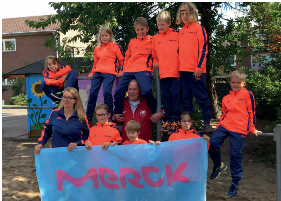
Unser Team sagt Danke!