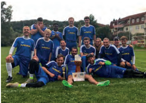
Das übergläckliche Saltbowl-Siegeteam