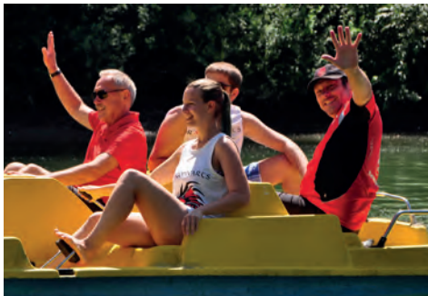
Spaß auf dem Tretboot