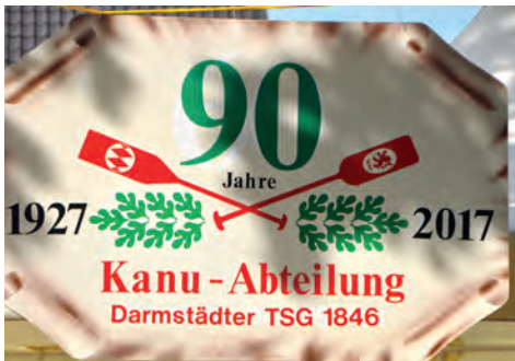
Ein Zufallsfund wird zum Aushängeschild