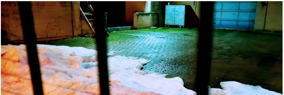
Abgetautes Eis in der Eissporthalle