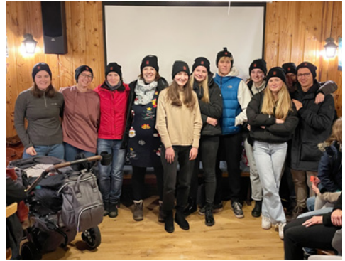
Legen die Grundlagen für zukünftige Meister*innen: Unser Team der Schwimmschule