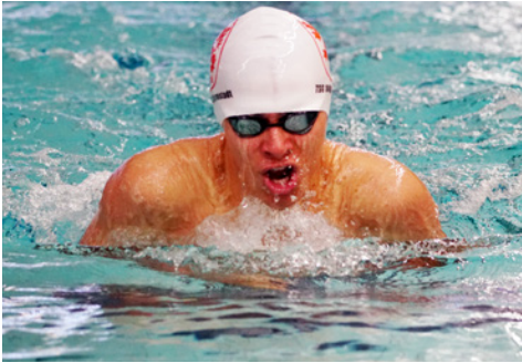
Brustlage - gib alles!