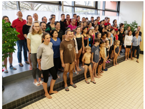
Schön, mal (fast) alle Aktiven zusammen zu haben!