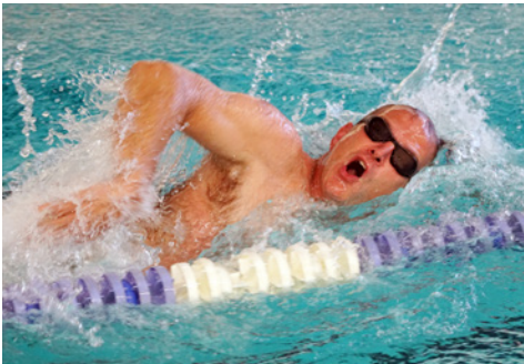
Kraullage - für die Ehre der Familie!