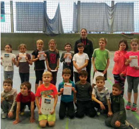
Nikolausfeier und Ehrungen der Bambini-Leichtathletikgruppe am 12.12.2017 in der Felsinghalle