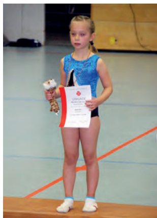
Aliena auf dem 3. Platz