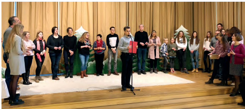
Zahlreiche ehrenamtliche Kampfrichter (oder deren Kinder)