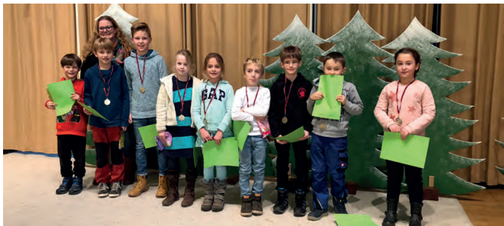
Nachwuchsmannschaft mit Ihren ersten Medaillen