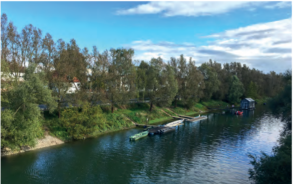
Altrhein bei Erfelden