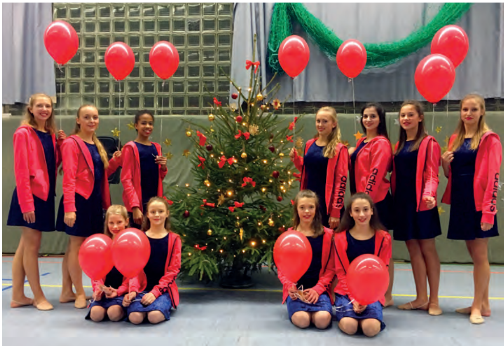
Die Gymnastinnen mit ihren neuen Vereinsjacken bei der Turschau im Dezember