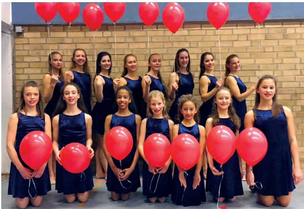
99 Red Balloons