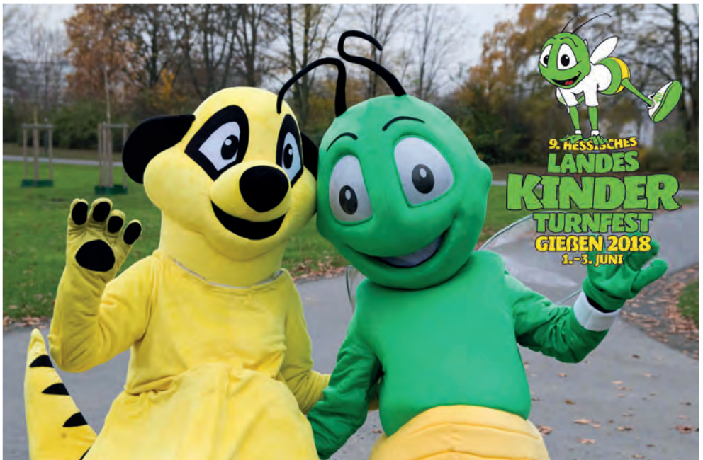
Mala als Turnfestmaskottchen aus Marburg erklärt Lumi, was ein Landeskinderturnfest ausmacht!