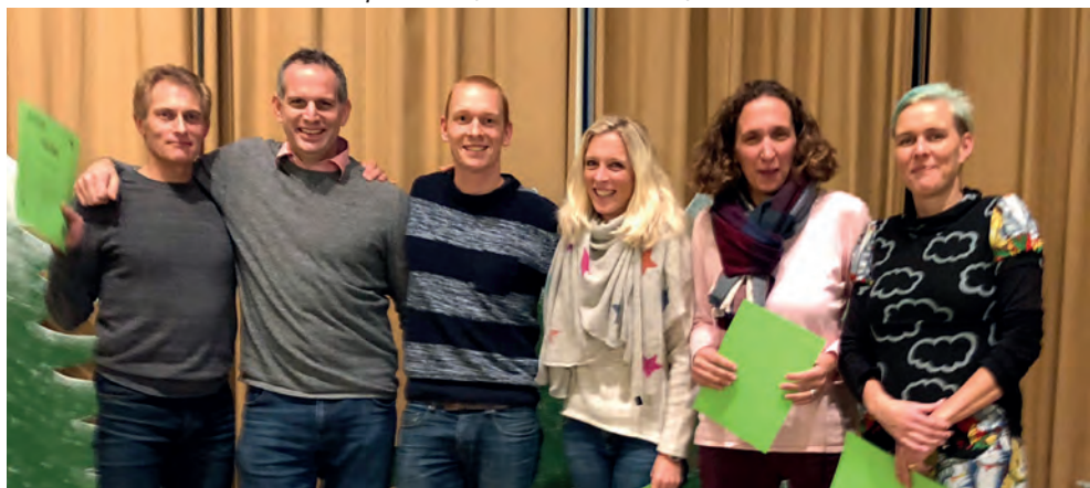
Sieger des Gästerennens