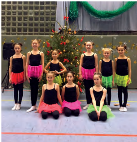
Nachwuchs der Rhythmischen Gymnastik

zuschauen, viel Zeit miteinander verbringen und Berlin erkunden. Die P-Mädels nahmen mit ihrer Seil-Gruppen-Übung zu peppiger Musik am Pokalwettkampf teil. Mit viel Ausdruck zeigten sie, dass sie auch in der Gruppe gemeinsam erfolgreich sein können und durften am Ende jubeln. Als Turnfestsieger ging dieser Wettkampf für sie zu Ende, was Trainer, Zuschauer und natürlich sie selbst sehr freute – Herzlichen Glückwunsch noch einmal.